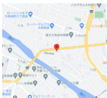
慶成学院八王子校